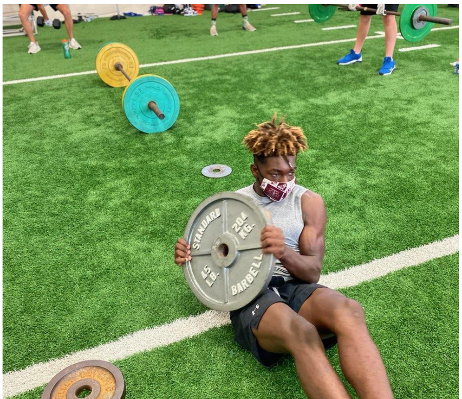
Foto: Chris West en las instalaciones de usos múltiples de la escuela secundaria