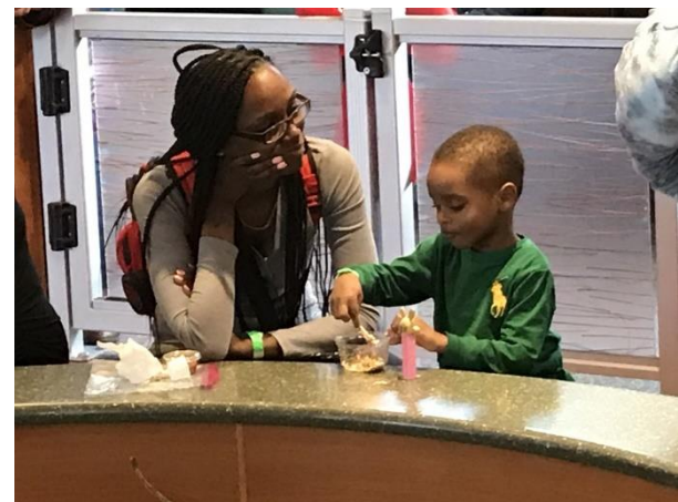
Actividad de cocinar con mama durante un paseo a Bellaboos.