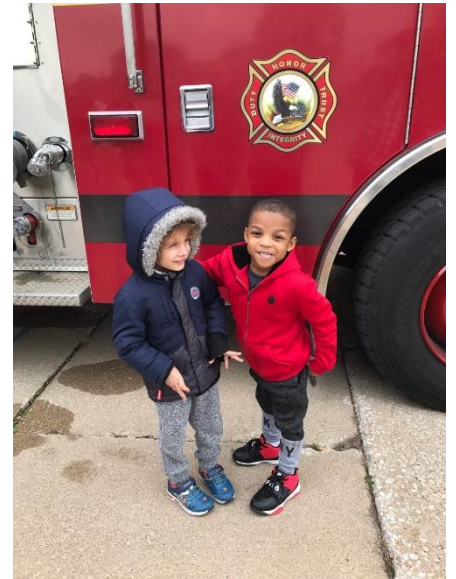
Visitar la estación de bomberos.

IDEAS to Work The reproduction of this document is encouraged. Permission to copy is not required. If you refer to another person please cite the original source. This is a project of the National Center for Pyramid Model Innovations, a project of the University of South Florida, Department of Education, Office of Applied Behavior Analysis. Funding provided by the Department of Education, Office of Applied Behavior Analysis. © 2013 National Center for Pyramid Model Innovations. All rights reserved. For more information, visit www.nationalcenterforpyramidmodel.org