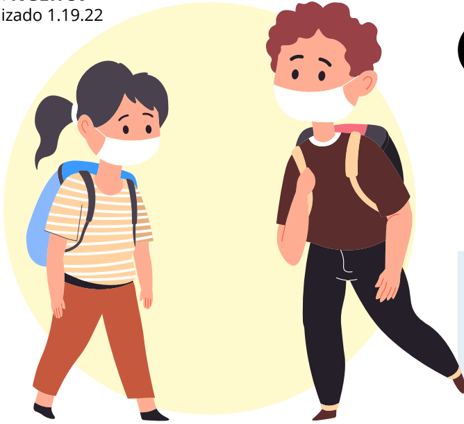
Diagrama de Aislamiento de COVID-19 Para Escuelas K-12