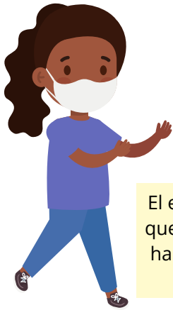
Diagrama de Cuarentena de COVID-19 Para escuelas K-12 Método de seguimiento de grupo

1 El estudiante estuvo expuesto en la escuela (independientemente del estado de vacunación)